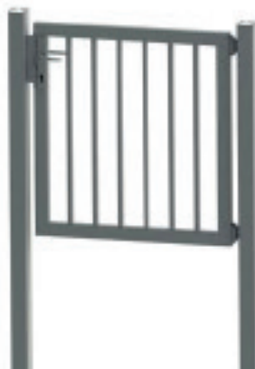
Rechteckrohr 30 x 20 mm