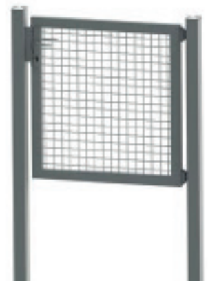
Wellengitter 50 x 50 x 5 mm