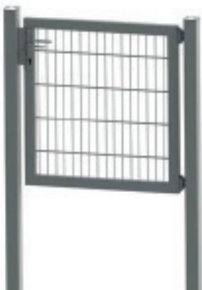
Flachstabmatte mit Maschung 50 x 200 mm